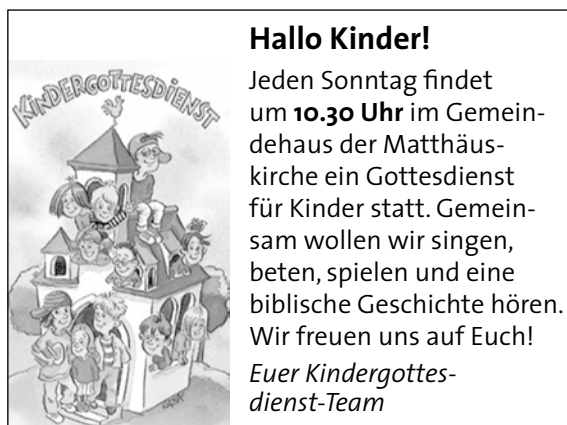
(Der Kindergottesdienst beginnt in der Kirche!)